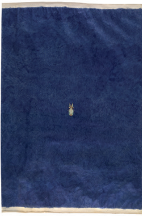
[Ill. 12] Jan Fabre (Antwerp [BEL] 1958), sans titre, 1989, Bic bleu, phyllie sur papier préparé, 219,5 x 151,5 cm. Acquis en 1991, inv. 11312.