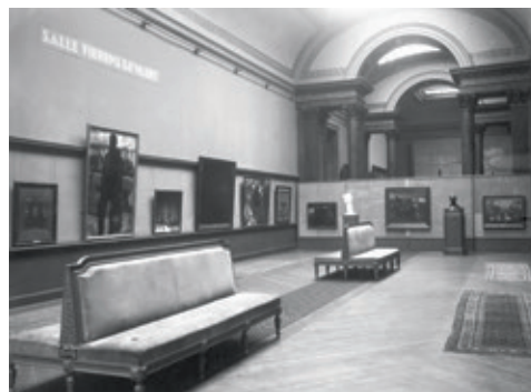
[Ill. 1] Vue de la salle Fierens-Gevaert consacrée à l'art moderne en 1927.

L'ouverture en 1984, sous l'impulsion du conservateur en chef Philippe Roberts-Jones, du Musée d'Art moderne tant attendu, conçu