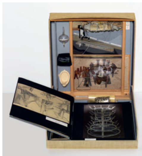
[Ill. 11] Marcel Duchamp (Blainville [FRA] 1887 – Neuilly-sur-Seine [FRA] 1968), De ou par Marcel Duchamp ou Rrose Sélavy (La boîte en valise) , [1958], boîte en carton recouverte de tissu contenant 68 objets, extrait d'une série de 30 exemplaires, 9 × 37,7 × 40 cm. Acquis en 2000, inv. 12082.