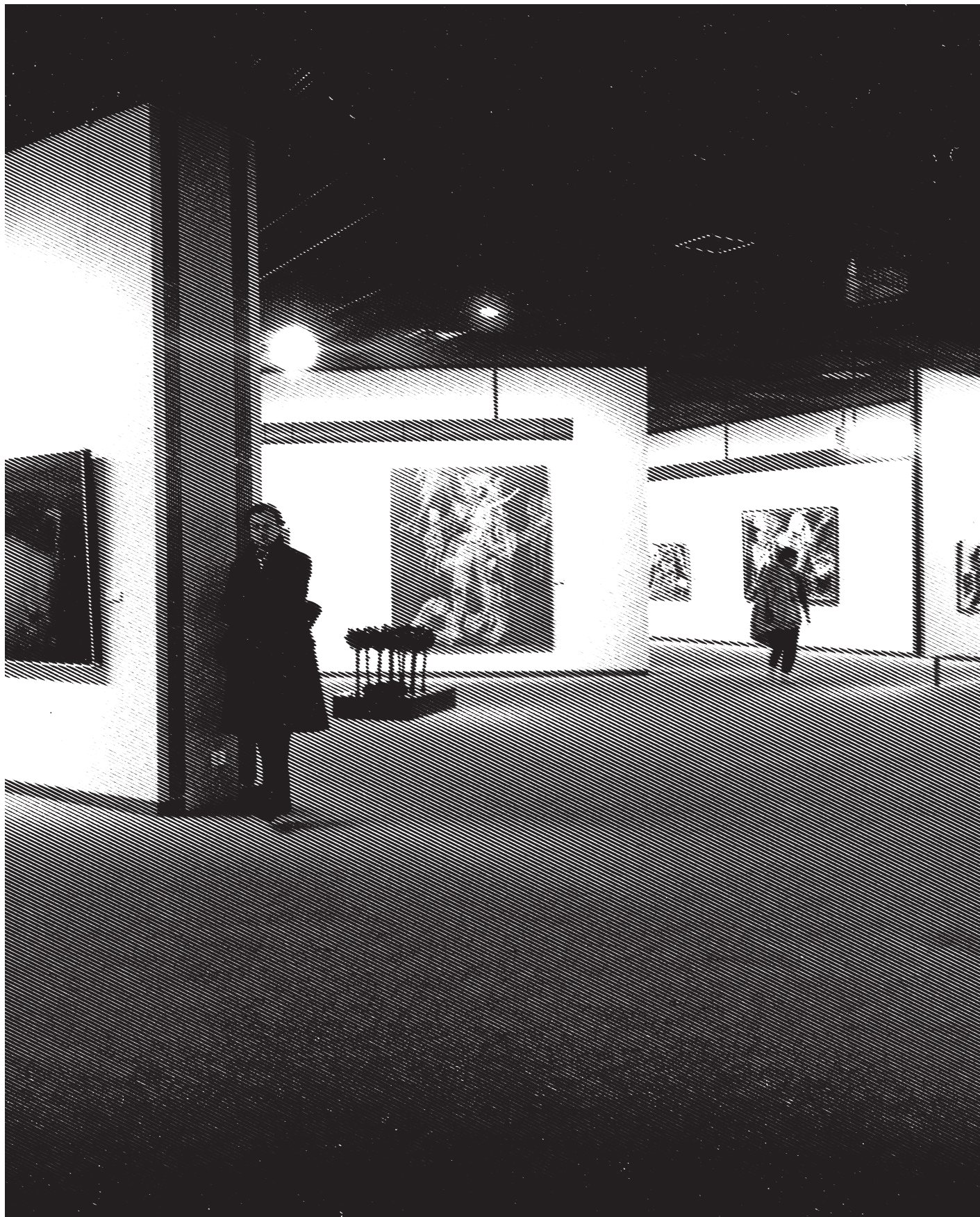
Les salles du Musée d'Art moderne érigé par Roger Bastin. Vue au début des années 1990.