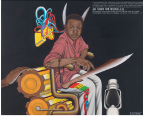
[Ill. 9] Chéri Samba (Kinto M'Vuila [COD] 1956), Je suis un rebelle , 1999, acrylique sur toile, 81 × 100 cm. Acquis en 2020, inv. 12602.