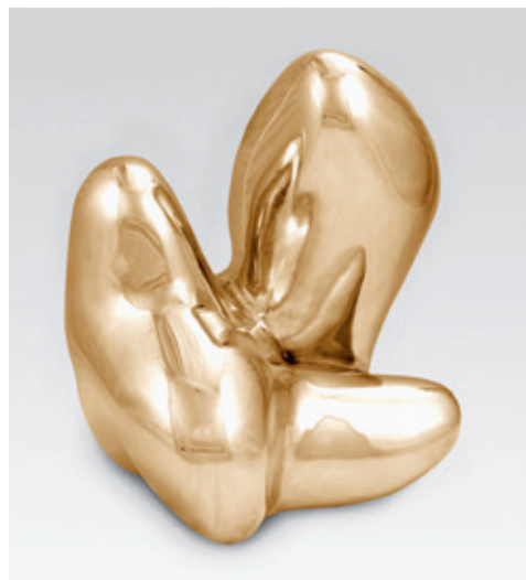
[Ill. 5] Jean Arp (Strasbourg [FRA] 1886 - Locarno [ITA] 1966), Mirr , [1936], bronze doré, 38,5 x 32 x 34 cm. Acquis de l'artiste à l'exposition 50 ans d'art moderne , 1958, inv. 6815.

mouvement artistique avant-gardiste européen d'après-guerre n'occupent qu'une place modeste dans la collection. Les ensembles de dessins, gouaches et autres œuvres sur papier CoBrA et post-CoBrA, en revanche, sont riches et diversifiés, avec en vedette les calligraphies d'inspiration orientale de Pierre Alechinsky. Dans ces mêmes années d'après-guerre, le modernisme abstrait s'insinue aussi peu à peu dans la collection à travers la génération de la Jeune Peinture belge. L'œuvre de jeunes artistes comme Antoine Mortier, Louis Van Lint et Jo Delahaut a beau être difficile à grouper sous un même dénominateur, il n'en reste pas moins que ces abstraits lyriques ont en commun une recherche effrénée de la libre expression.