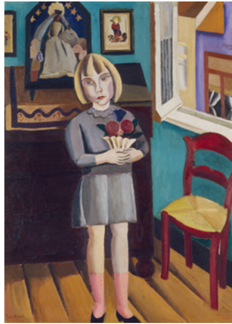
[Ill. 3] Gustave De Smet (Gand [BEL] 1877 - Deurle [BEL] 1943), Béatrice , [1923], huile sur toile, 140 × 100 cm. Don du Comité Fierens-Gevaert, 1927, inv. 4678.

Si l'expressionnisme et plus encore le surréalisme sont considérés aujourd'hui comme les ensembles les plus riches de cette collection, c'est parce qu'ils témoignent, en tant qu'entité, du réseau artistique, culturel et social qui a promu le développement de ces courants artistiques. Ces ensembles sont à la fois cohérents et protéiformes, et les œuvres d'art qui les composent ont souvent en commun un parcours d'exposition parallèle ou ont fait l'objet de publications d'époque. Ils témoignent de l'état d'esprit qui régnait dans