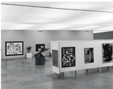
[Ill. 4] Vue de l'exposition 50 ans d'art moderne , à l'Exposition universelle de Bruxelles en 1958. Les œuvres visibles de Kenneth Armitage, Victor Vasarely et Serge Poliakoff ont été acquises par les MRBAB.

À partir de 1948, une aile dynamique du groupe CoBrA se développe à Bruxelles sous l'impulsion du poète Christian Dotremont. Pourtant, la peinture et la sculpture du premier