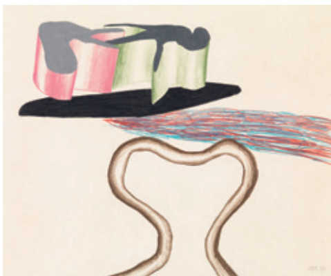
[Ill. 10] David Hockney (Bradford [GBR] 1937), American Landscape Pie , 1965, pastel gras sur papier, 35,5 × 42,8 cm. Legs de Mme Alla Goldschmidt-Safieva, inv. 11182.

des techniques. La collection des dessins modernes apparaît enfin dans l'organisation des musées, bien que celle-ci soit d'abord, pour des raisons pratiques, fusionnée avec celle des sculptures. Il n'en est cependant pas de même pour le système des acquisitions, gérées depuis 1933 par trois commissions distinctes : art ancien, art moderne et sculpture. Au départ associées aux acquisitions de peinture, les œuvres sur papier entrent peu en ligne de compte dans la définition d'une politique d'acquisition. Ce n'est qu'en 1979 qu'elles font l'objet d'une nouvelle commission englobant les acquisitions en matière de sculpture, de dessins et d'affiches modernes, qui traitera également de la photographie. Cette évolution plutôt lente s'explique par le peu d'intérêt des musées et même du public belge à l'égard des techniques sur papier, en dehors des grands noms internationaux.